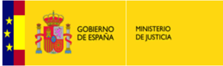
TABLA CONSOLIDADA DE CONSULTAS VINCULANTES DE LA DIRECCIÓN GENERAL DE TRIBUTOS